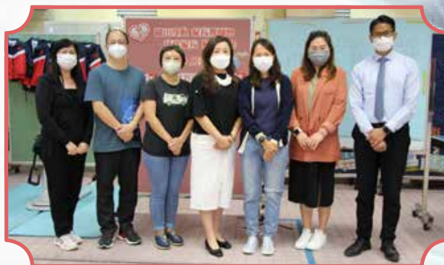
多謝校長、老師和家長