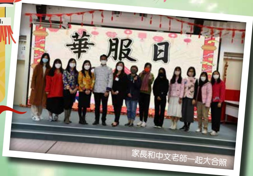
家長和中文老師一起大合照

今年的喜氣洋洋賀新春活動有影片欣賞、做手工、經典名句擂台等，其中最矚目的就是華服表演和「武·獅隊」精彩表演，今年更增設了少數民族服飾走秀，讓同學大飽眼福。最後感謝家教會主席及委員鼎力支持，親手為同學製作精美的新年掛飾、準備美味的賀年食品及大抽獎禮物。