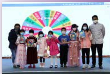
獲獎的同學各有姿態