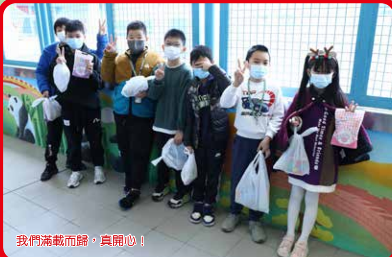
我們滿載而歸，真開心！