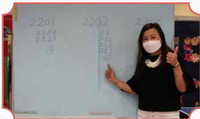
我是五年級梅詩睿家長