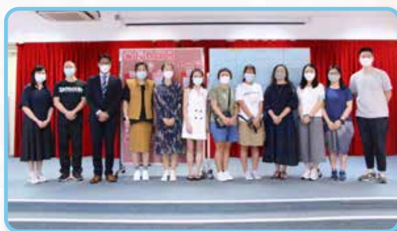
第十二屆家教會老師及家長委員合照