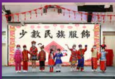
我們這班超級模特兒有型有款