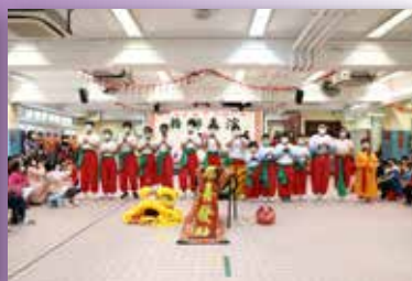
「武·獅隊」的同學個個神采飛揚