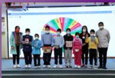
幸運兒拿著戰利品真開心