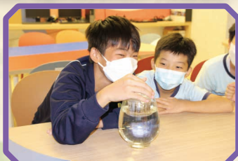
同學獲選成為生命教育長， 十分興奮。