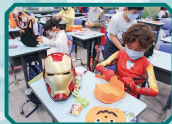
鐵甲奇俠都來到耀山學校 做手工。