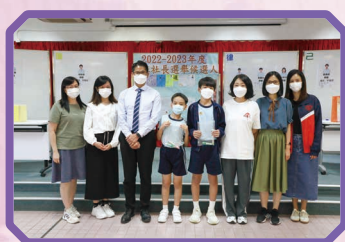
明社社長和社監合照