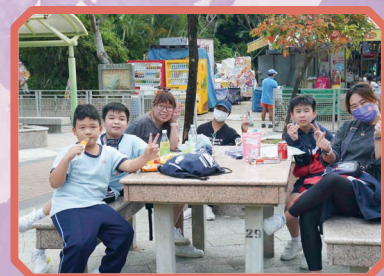
同學們和家長都玩得十分開心。