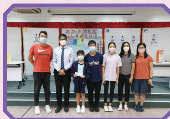
道社社長和社監合照