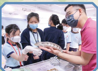
這位女同學鼓起勇氣，嘗試 觸摸蜥蜴。