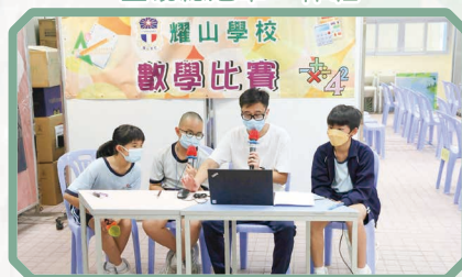
老師好助手協助教授數學技巧