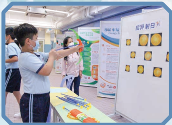
學生參加中秋攤位遊戲 「后羿射日」。