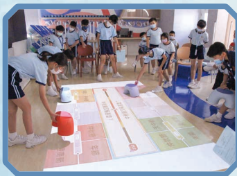
同學十分投入參與 「互動地板遊戲」。