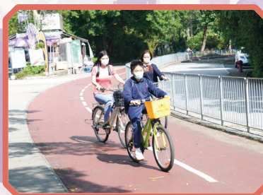
同學們自由自在地騎自行車。