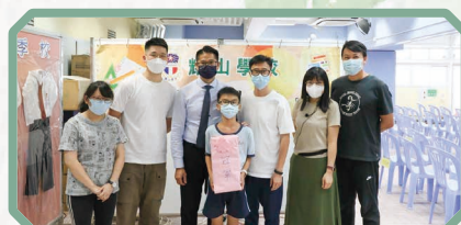
恭喜今年度社際數學比賽 全場總冠軍 -- 律社