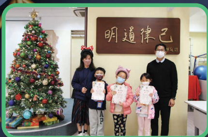
高級組冠、亞、季軍學生合照