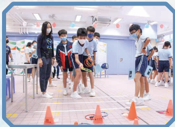
同學參加中秋攤位遊戲 「中秋物品拋拋拋」。