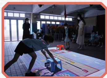
學生投入參與地板遊戲。