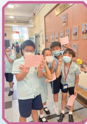
同學們都很踴躍參加朗 讀經典名句活動。