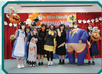
老師們為同學準備了很多不 同的萬聖節遊戲活動，希望 同學都能盡興而歸。