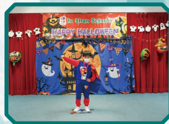
同學都為 Halloween 活動 悉心打扮一番。