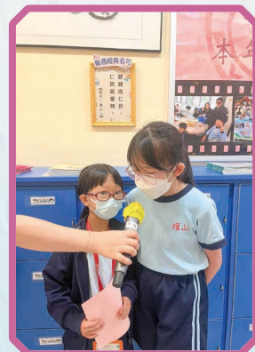
三年級同學正在朗讀經 典名句。