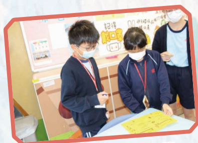
同學可向班內的英文大使朗讀 words of wisdom，從而獲取獎印。