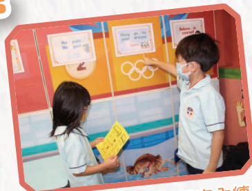
低年級學生可以在課室內練 習 words of wisdom。