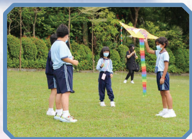
同學們盡情地放風箏。