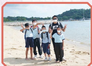
同學們在沙灘玩耍。