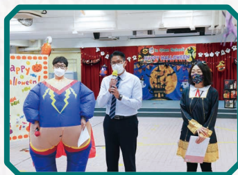
石校長為當天精彩的節目 致開幕辭。