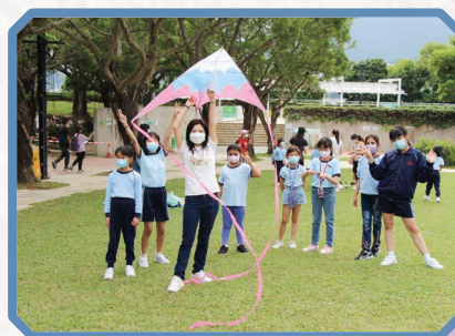
同學們盡情地放風箏。