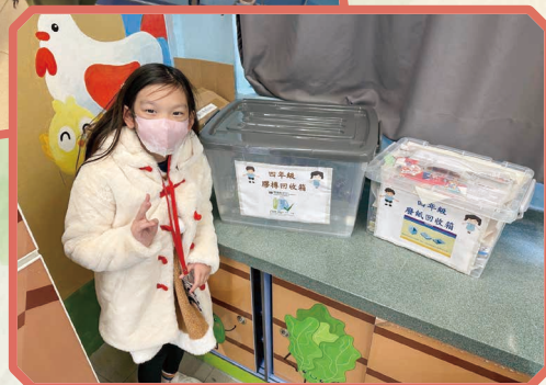
這位女同學積極參與回收活動。