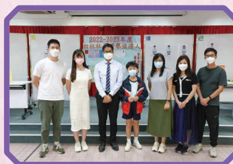
律社社長和社監合照