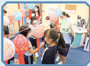
同學們認真地猜燈謎。