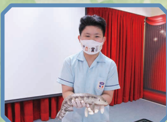
這位高年級同學開心地捧著 手中的蜥蜴。