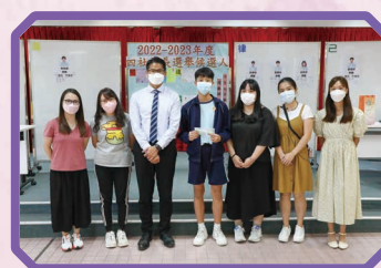
己社社長和社監合照