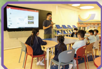
同學們認真地聽老師介紹 魚菜共生系統。