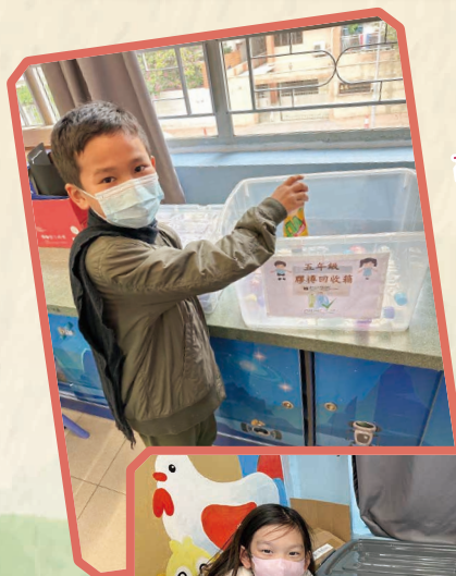
高年級同學積極 參與回收膠樽。