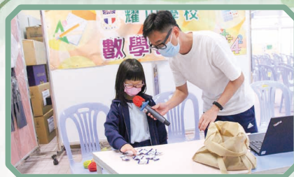
以二年級學生一手拿到糖果數量作 參照去估算老師一手拿的數量